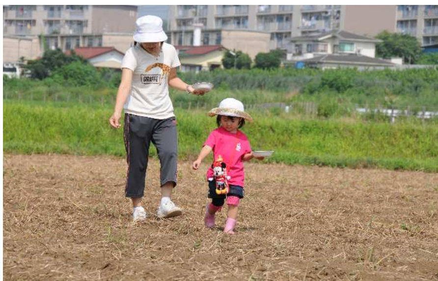
コスモス畑に種まき