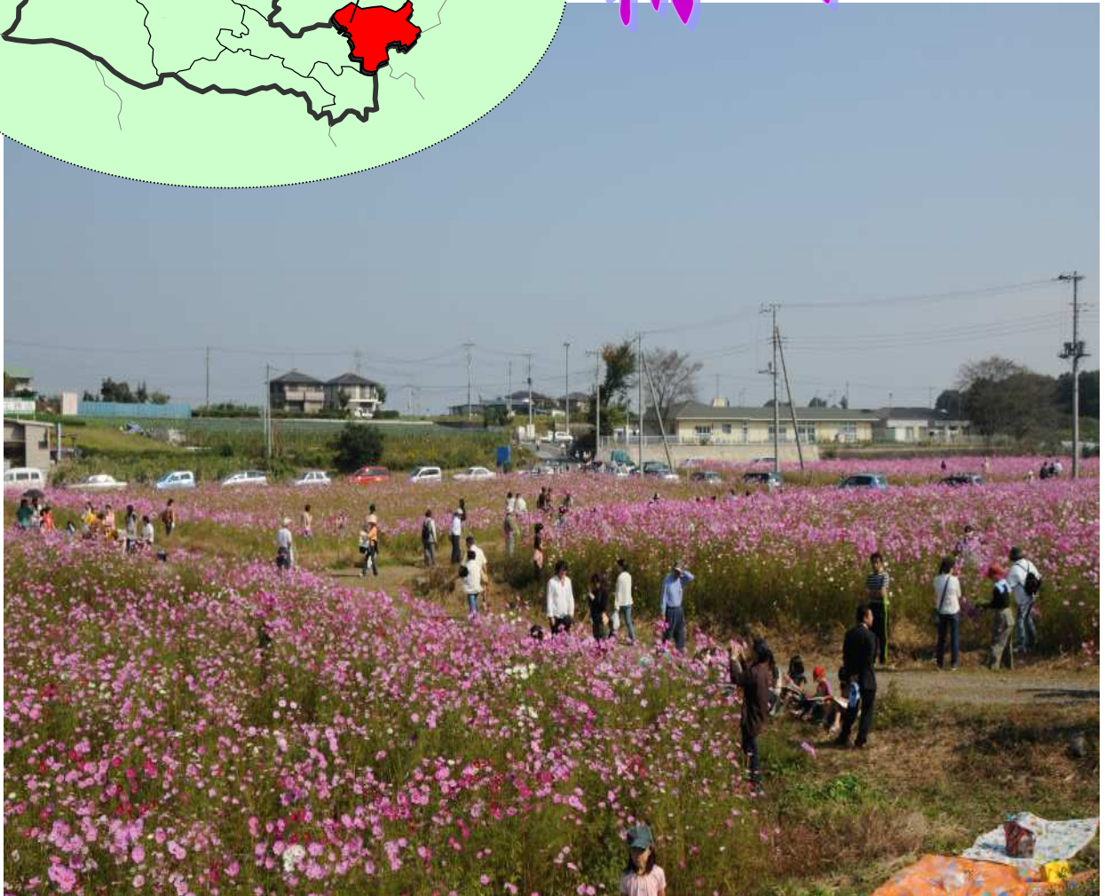
コスモスの里まつり

精明地区は飯能市の東部に位置し、田園地帯が広がり、果樹や野菜の栽培が盛んで自然豊かな地区である。