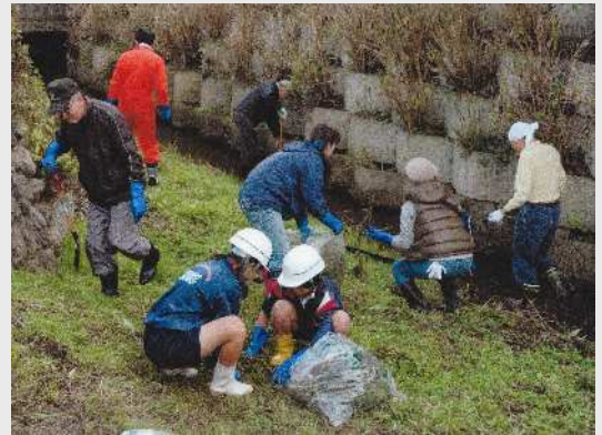
第一中学校生徒とのクリーン活動

また、平成26年度から精明小学校より下流域でのクリーン活動も飯能第一中学校生徒と地域自治会、営農組合の皆さんと共に行っている。