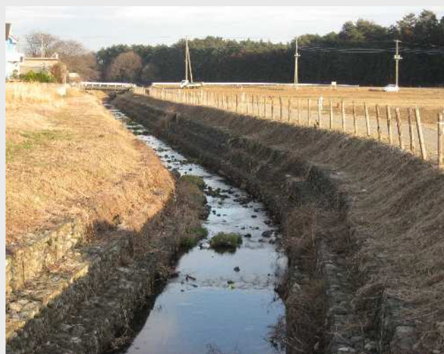
カワニナを放流した南小畔川